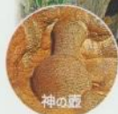
国指定史蹟天然記念物 龍河洞(香美市)